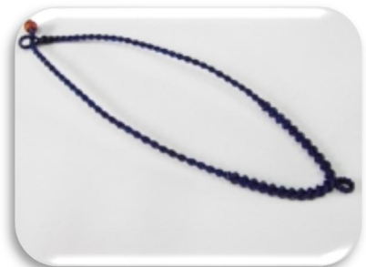
สร้อยถักประสมเกลือ+กระดุงู