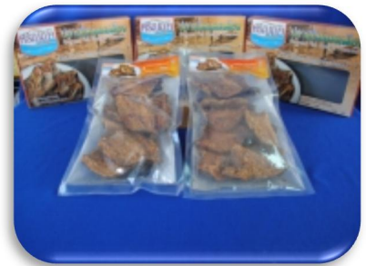
พลาสติกทอดกรอบ