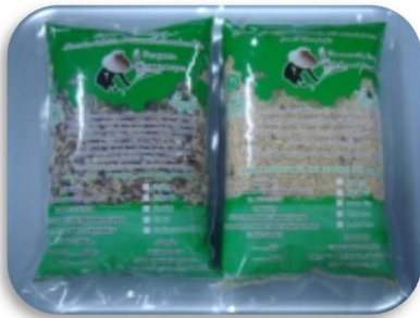
ข้าวกล้องสุภาพ