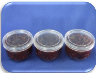
น้ำพริกพลาสติก