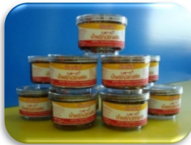
น้ำพริกพลาสติก