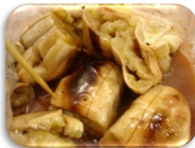
กล้วยปิ้งอบน้ำผึ้ง แม่สำเนา